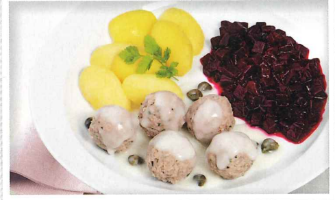
Klops „Königsberger Art“ aus Rind- und Schweinefleisch

dazu Rote-Bete-Gemüse und Salzkartoffeln