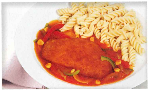
Paniertes Schweineschnitzel mit pikanter Schaschlik-Soße dazu Spiralnudeln