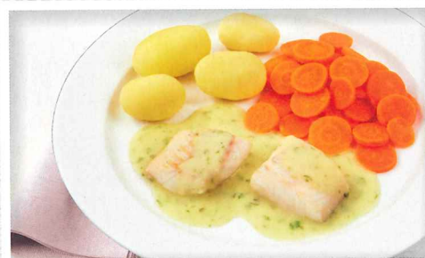
Filetstücke vom Schellfisch in Senf-Kräutersoße