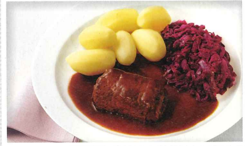
Rinderroulade „Hausfrauen Art“

in herzhafter Bratensoße mit Apfelrotkohl und Salzkartoffeln